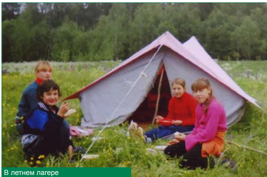
В летнем лагере

щее из ярких «я», что и является нашей целью.