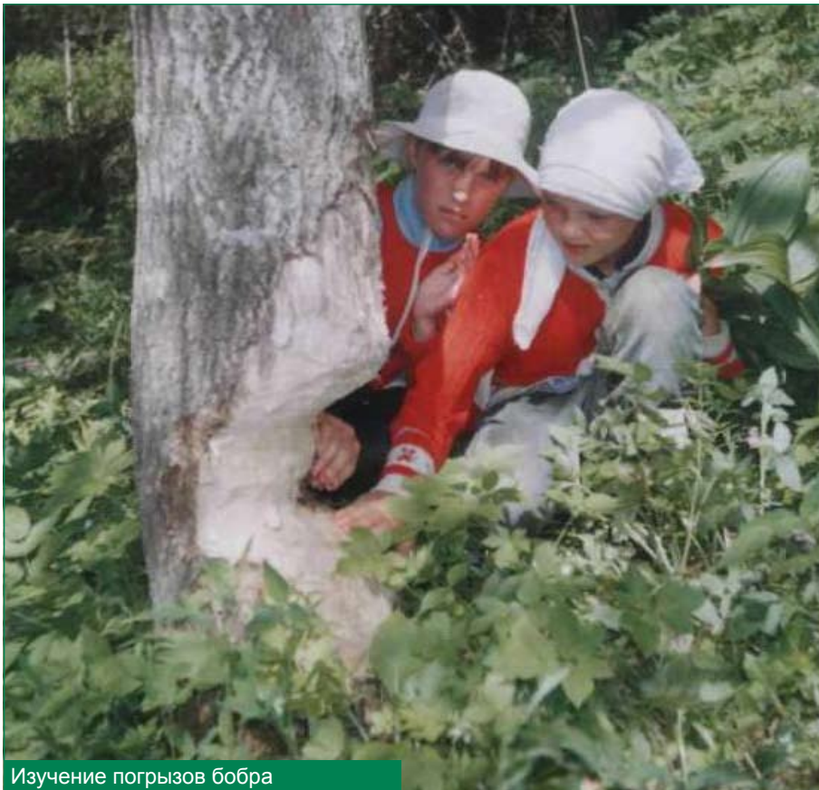
Изучение погрызов бобра

не, нельзя не остановиться еще на одном временном детском общественном объединении – активе школьного музея природы. В процессе выполнения эколого-социального проекта по созданию музея природы в Матвеевской основной школе не только обобщались, систематизировались материалы, оформлялись экспозиции, но и произошло объединение подростков в коллектив, в котором они учи-