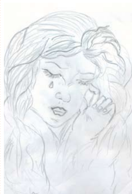
Рисунок В. Малышевой

Тоскуют детские сердца. За что же судьбы нам такие? ...Без матери и без отца Нам очень сложно в этом мире.