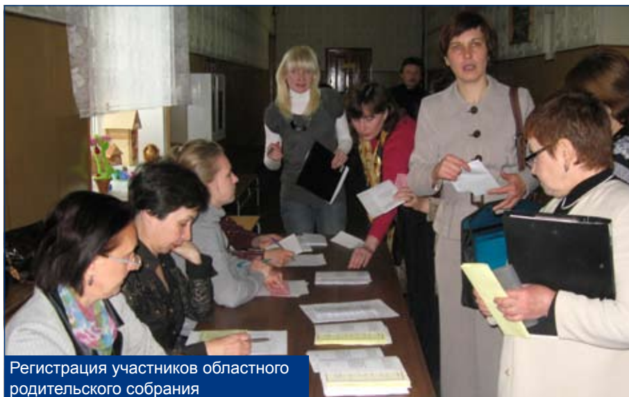
Регистрация участников областного родительского собрания