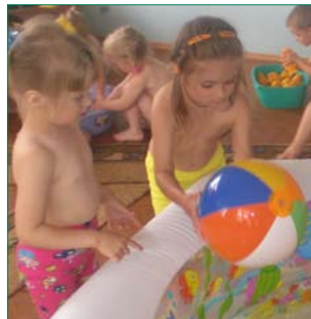
Воспитанники МДОУ «Нюксенский детский сад общеразвивающего вида № 2»

Мы гордимся успехами своих учеников и профессиональными достижениями педагогов. И хотя сегодня система образования района претерпевает сложные изменения, мы надеемся, что процесс оптимизации пройдет достойно и будет способствовать дальнейшему повышению качества образования.