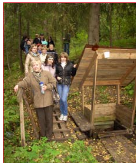
В окрестностях Владимирки. У родника

Я убеждена, что разбуженное исследовательское начало непременно послужит импульсом для развития новых интересов, станет стимулом для творческого подхода к любой работе. Поэтому учу ребят понимать себя и других и, что самое главное, осознавать свое место в обществе.