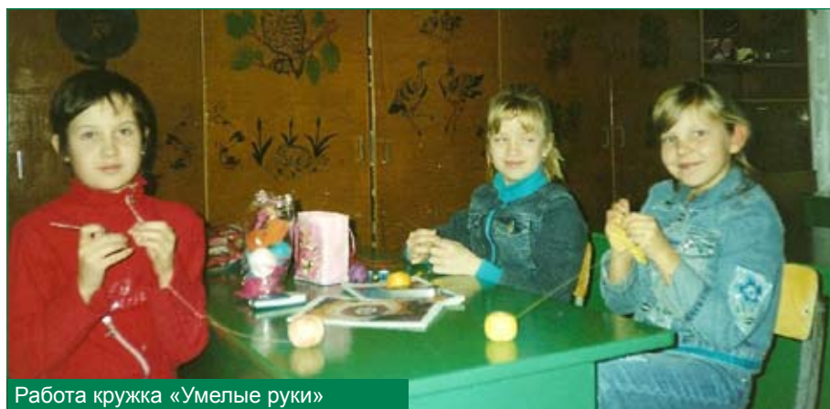
Работа кружка «Умелые руки»

Класс – первичный коллектив, но в процессе общей работы формируется чувство школы, чувство «мы», состоя-