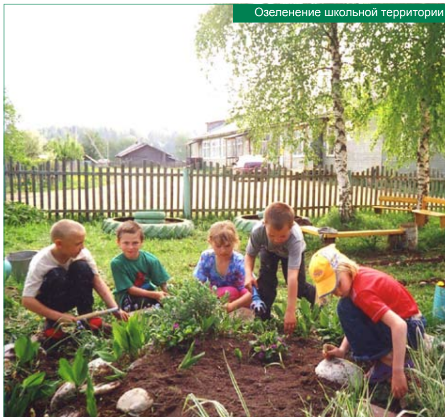
Озеленение школьной территории

Раскрывая особенности детско-го экологического движения в райо-