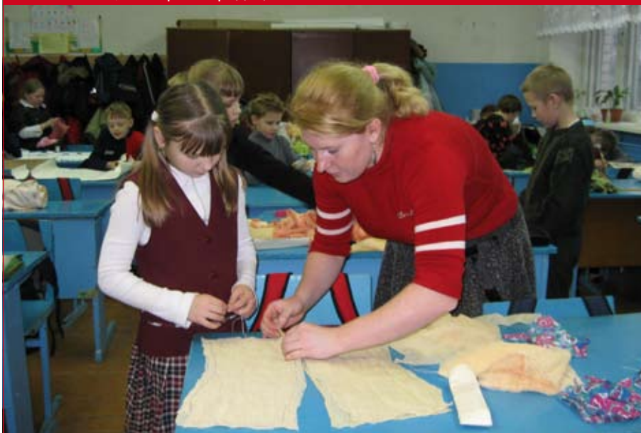
Учащиеся 4в класса на общешкольном мероприятии «Любовь моя, мой край Городецкий»

ли самые разные: о своей семье и домашних питомцах, о своих друзьях и здоровом образе жизни – и с успехом участвовали в муниципальных конкурсах «Детский компьютерный проект» в 2006–2009 годах.