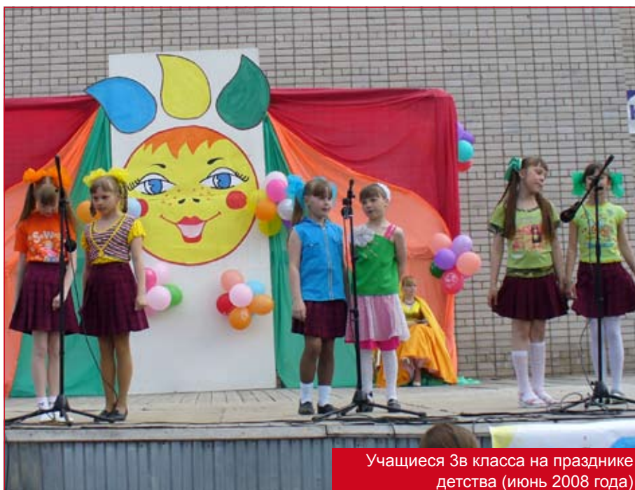
Учащиеся 3в класса на празднике детства (июнь 2008 года)

Свои силы в литературном творчестве пробуют все, подтверждая слова