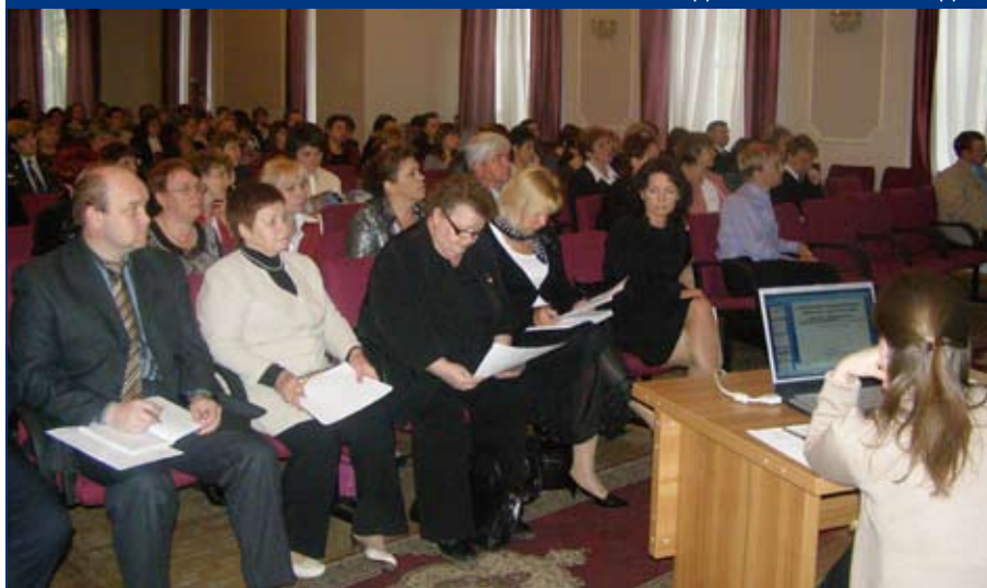
Участники областного родительского собрания в зале Вологодского педагогического колледжа

Система технологической подготовки школьников на основе проектной деятельности формирует у них такие личностные качества, как терпимость, коммуникабельность, аккуратность, целеустремленность, творческий подход к делу, умение ценить время. Это не только оптимизирует процесс социализации выпускника, но и значительно облегчает его профессиональное самоопределение.