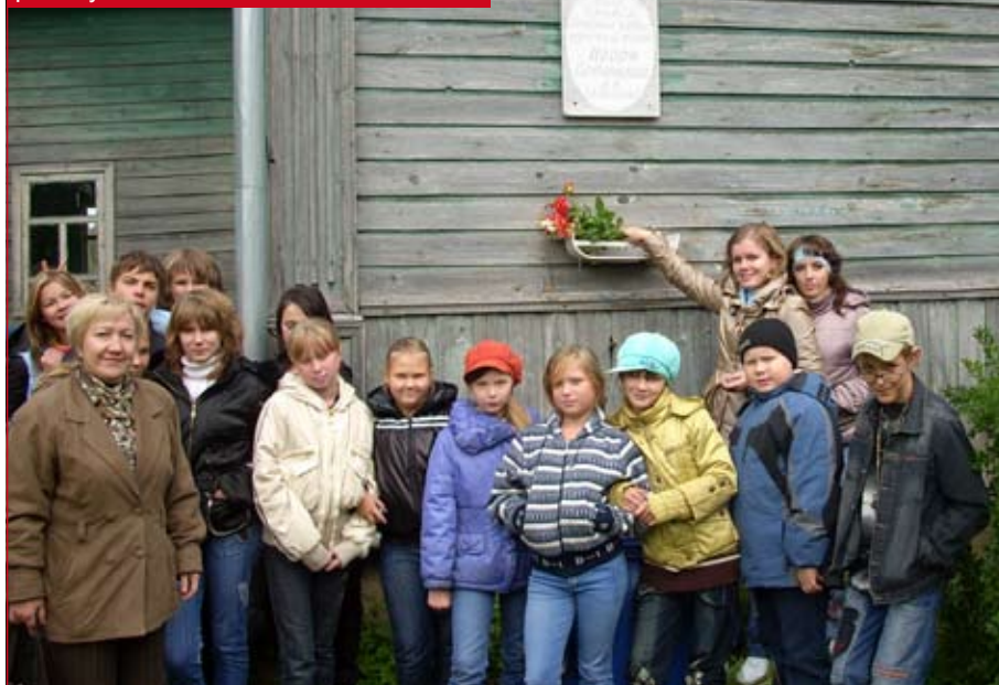
Владимировка. Цветы Игорю Северянину