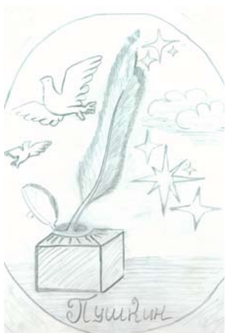
Рисунок В. Малышевой

Среди друзей он был талантом И выделялся из толпы – Интеллигентный и галантный, Дарил сонеты и цветы.