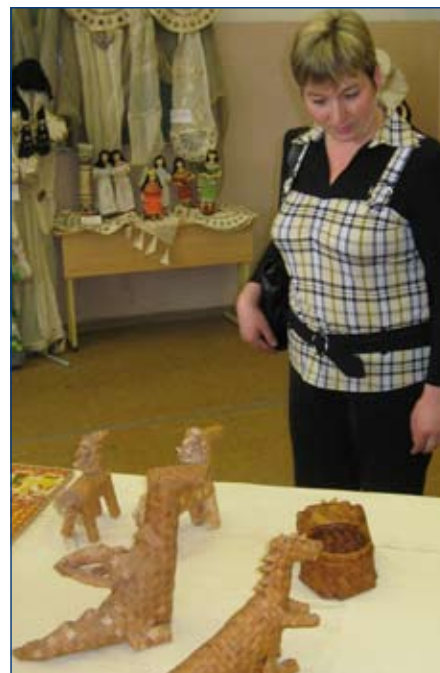
На выставке работ воспитанников учреждений дополнительного образования детей

Редакция предлагает вниманию читателей фрагменты выступлений участников собрания.