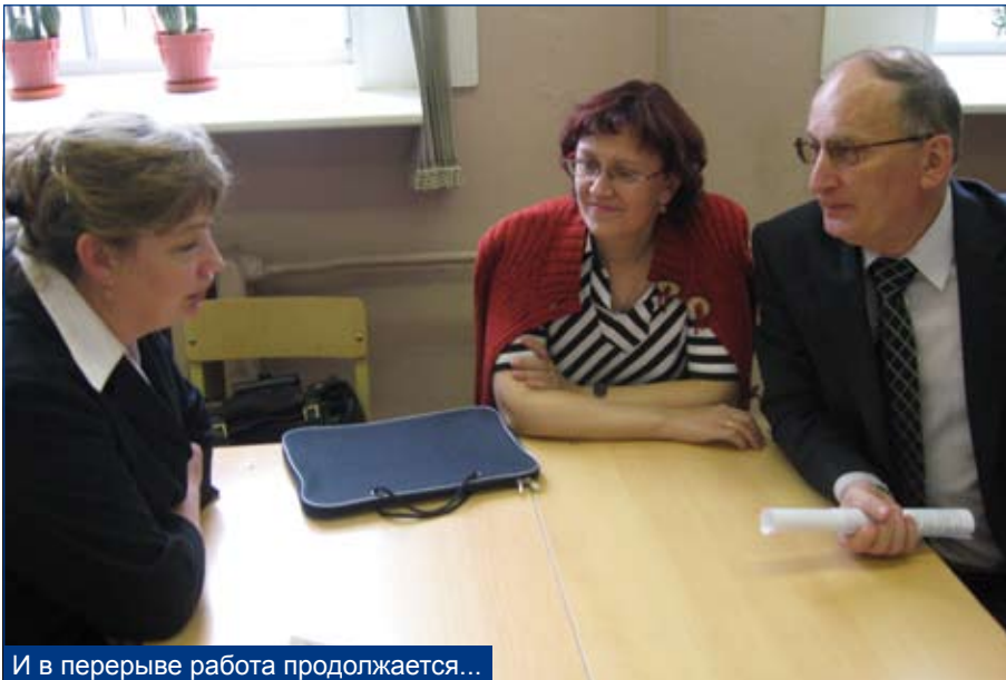
И в перерыве работа продолжается...

Почему в этом нормативе отсутствуют деньги на учебники и учебные пособия (согласно п. 6.1 статьи 29 Закона РФ от 10.07.1992 № 3266-1 «Об образовании»)? Почему родители должны покупать эти учебники? Причем до сих пор никто родителям не может сказать, какие именно учебники надо купить. По опыту прошлых лет знаем, что некоторые учебники так и не удалось найти, а некоторые (при одинаковых названиях, авторах и издательствах) не подходили: год издания другой.