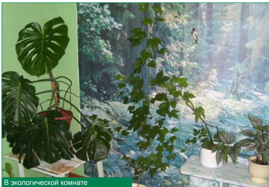
В экологической комнате

Такие экологические пространства позволяют педагогическому коллективу вести успешную работу по формированию экологически грамотного, нравственного поведения детей в природе, а детям – увидеть неразрывную связь живого организма с внешней средой; появление нового организма (растительного, животного), его рост,