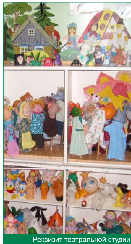
Реквизит театральной студии

Большинство детей к окончанию детского сада относится к природе положительно, в их поведении практически не наблюдается негативных проявлений. Они с удовольствием общаются с животными, наблюдают за их жизнью, охотно откликаются на просьбу взрослых помочь в делах. У детей сформирован широкий круг представлений о природе, они достаточно уверенно ориентируются в правилах поведения в природе, стараются их придерживаться. Мотивом бережного отношения к животным и растениям выступает понимание ценности жизни, проявление гуманного отношения к любому живому существу, стремление к совершению добрых поступков.