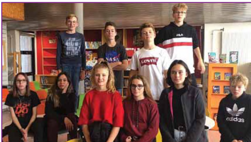
Французские друзья из collège Paul – Emile Victor de Corcieux с очередным видеообращением

Наш новый проект рождается из переписки с учениками Lilian and Abraham Memorial Academy. Это