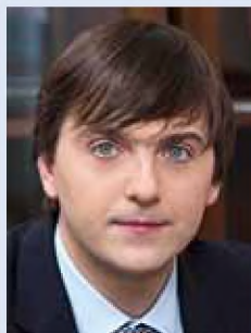
КРАВЦОВ Сергей Сергеевич, Министр просвещения Российской Федерации

В оспитание детей – это стратегический национальный приоритет. И оно должно стать центральной темой системы образования, объединив усилия не только родителей и педагогов, но также общественных организаций, бизнеса, органов власти.