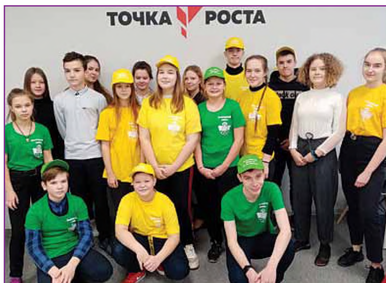
Обучающиеся Огарковской средней школы имени М.Г. Лобытова, участники проекта «Мост дружбы»

ку практически полностью совпадают, в содержании, организации и формах наблюдаются существенные различия.