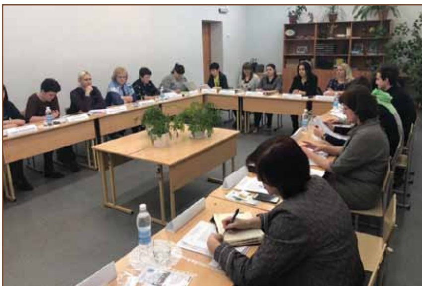
Заседание управляющего совета МБОУ «Средняя школа №1 г. Грязовца».

Перечислим основные результаты 12-летней деятельности системы государственно-общественно-