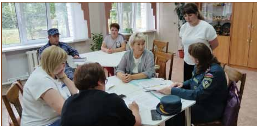
Заседание межведомственной комиссии

ственными участниками позитивных изменений, происходящих в ОУ. Об этом говорят результаты независимой оценки качества образования, которая проводится Министерством образования 1 раз в три года с привлечением специализированных организаций. Вот некоторые из них: удовлетворенность условиями оказания услуг: школы – 98,4%, учреждение дополнительного образования – 99,8%, детские сады – 97,3%; доброжелательность, вежливость работников: школы – 98,3%, учреждение